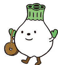
ウボイ PR キャラクター トゥレップン

先住民族であるアイヌの尊厳を尊重し、国内外にアイヌの歴史・文化等に関する正しい認識と理解を促進するとともに、新たなアイヌ文化の創造及び発展に寄与します。